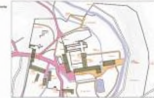
Sichtweise von Umgebung und Darstellung von Umgebung