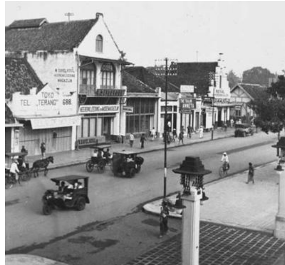
Gambar 1. Suasana Yogyakarta tahun 1930

dilakukan, bertemu dengan tradisi masyarakat setempat yang semi-tradisional dalam kegiatan industri batik. Jejak perjalanan industri batik Yogyakarta masa lampau, juga menarik produsen pembatik asing seperti Cina, Belanda, Arab, dan Jepang.