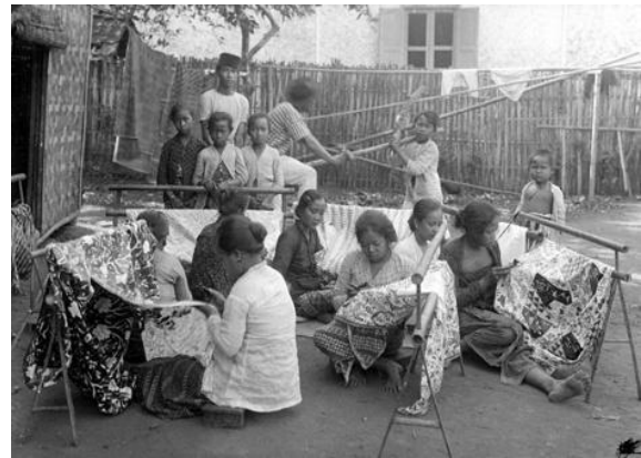
Gambar 4. Pembatik di Yogyakarta 1910-1940

jumlah pekerja tersebut, namun hal ini menarik perhatian Kantor Perburuhan Belanda.