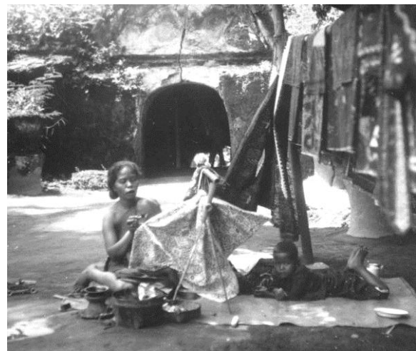
Gambar 5. Pembatik di Tamansari

Pekerjaan batik juga melibatkan banyak orang tua. Masyarakat kota Yogyakarta adalah masyarakat berpelapisan sosial, yang membedakan kaum bangsawan dan biasa. Di lingkungan bangsawan kerap terlihat istri pangeran yang membatik dan memenuhi kebutuhan sandang keluarga. Terdapat sikap enggan kalangan bangsawan untuk bekerja berkelompok dengan masyarakat biasa. Namun ketika kebutuhan ekonomi mendesak, banyak dari pangeran itu bekerja sebagai tukang kerok (Angelino, 1931). Sikap pragmatis ini juga berlangsung pada masa-masa kemudian.