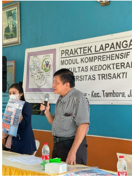
Gambar 2. Foto Kegiatan Penyuluhan di PkM Krendang