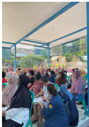
Gambar 4. Foto Para Peserta Penyuluhan PkM Krendang.