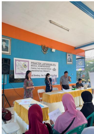
Gambar 3. Foto Penyuluhan Pencegahan Hemorrhoids pada Lansia.