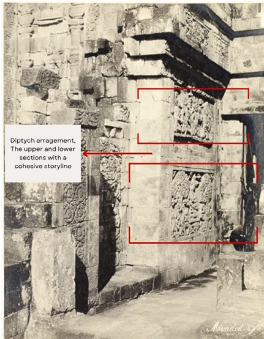
Konsep diptych relief dewi hariti and isyasawataka