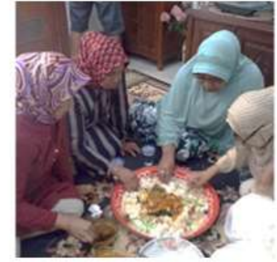
Tradisi dan Budaya yang Masih Dilakukan di Rumah Tinggal Orang Minangkabau Perantauan; (Resky Annisa Damayanti, 2021)