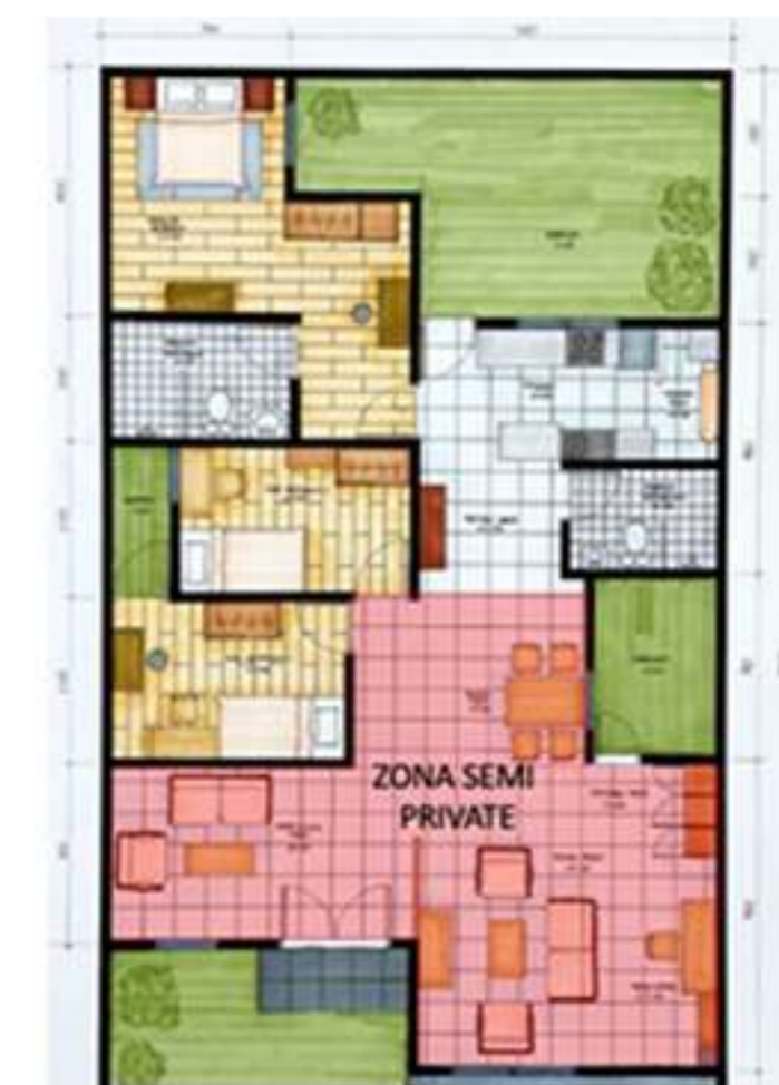
Rekomendasi Layout Furniture; (Jelly Tan, 2021)