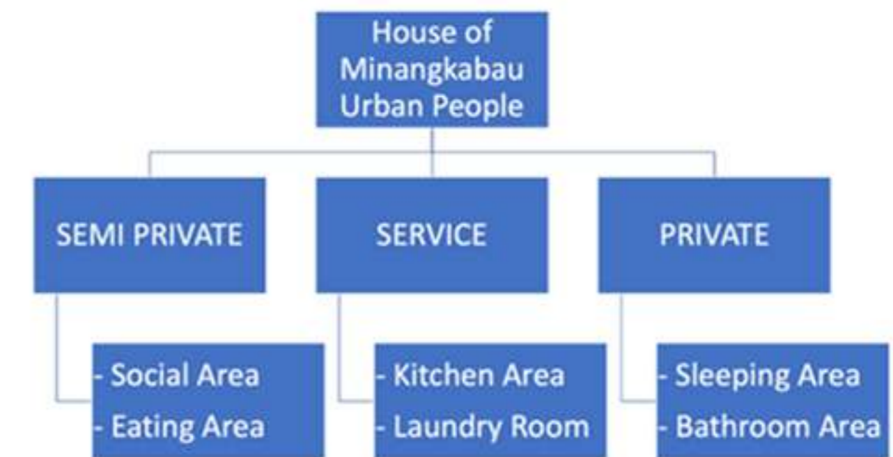
Bagan Pengelompokan Zoning dan Grouping Rumah Tinggal Masyarakat Minangkabau di Perantauan; (Resky Annisa Damayanti, 2023)