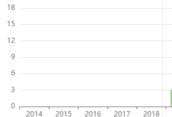
Journal By Google Scholar