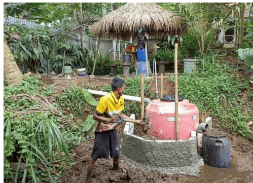
Gambar 2. Digester biogas dari kotoran kambing

Pada proses perangkaian tangki dan pipa harus dapat dipastikan bahwa tidak ada sambungan yang bocor. Fasilitas lain yang harus disiapkan adalah inlet sebagai tempat memasukkan kotoran kambing sebagai material penghasil biogas dan outlet sebagai tempat untuk mengeluarkan ampas kotoran kambing. Tangki digester ditempatkan secara terpendam ke tanah sedalam \pm 60 cm untuk menjaga kualitas proses fermentasi kotoran kambing. Komposisi material penghasil biogas adalah 1:2 artinya sebanyak satu bagian kotoran kambing yang sudah bersih dari jerami dicampur dengan 2 bagian air. Pencampuran dilakukan sampai kotoran kambing menjadi slurry . Proses fermentasi memerlukan waktu 10-14 hari sampai menghasilkan biogas yang dialirkan ke ban dalam mobil sebagai indikator bahwa biogas sudah terbentuk. Gambar 2 memperlihatkan digester biogas yang siap digunakan.