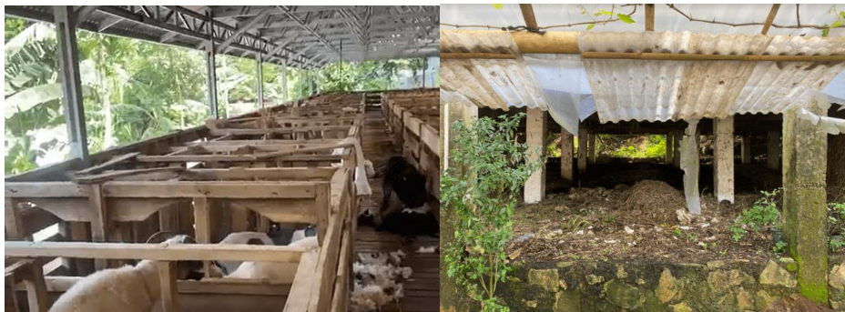
Gambar 1. Kandang kambing dan tempat kotoran kambing

Berdasarkan hasil survei diketahui bahwa El-Ardi Farm merupakan peternakan kambing yang menghasilkan kotoran kambing untuk dimanfaatkan sebagai pupuk (Gambar 1). Pemanfaatan limbah tersebut berpotensi untuk dikembangkan menjadi material penghasil biogas yang dapat dimanfaatkan sebagai sumber energi ramah lingkungan. Selain itu diketahui bahwa warga Desa Sukasari masih menggunakan bahan bakar minyak tanah dan kayu bakar untuk memenuhi kebutuhan energi dalam kegiatan memasak. Kondisi tersebut terjadi karena belum terdapat alternatif sumber energi bersih yang ekonomis, sementara energi menjadi kebutuhan esensial dalam aktivitas rumah tangga. Warga belum mengetahui pemanfaatan kotoran kambing sebagai penghasil biogas yang dapat dimanfaatkan untuk menyalakan kompor.