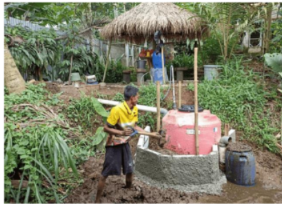
Gambar 2. Digester biogas dari kotoran kambing

Pada proses perangkaian tangki dan pipa harus dapat dipastikan bahwa tidak ada sambungan yang bocor. Fasilitas lain yang harus disiapkan adalah inlet sebagai tempat memasukkan kotoran kambing sebagai material penghasil biogas dan outlet sebagai tempat untuk mengeluarkan ampas kotoran kambing. Tangki digester ditempatkan secara terpendam ke tanah sedalam \pm 60 cm untuk menjaga kualitas proses fermentasi kotoran kambing. Komposisi material penghasil biogas adalah 1:2 artinya sebanyak satu bagian kotoran kambing yang sudah bersih dari jerami dicampur dengan 2 bagian air. Pencampuran dilakukan sampai kotoran kambing menjadi slurry . Proses fermentasi memerlukan waktu 10-14 hari sampai menghasilkan biogas yang dialirkan ke ban dalam mobil sebagai indikator bahwa biogas sudah terbentuk. Gambar 2 memperlihatkan digester biogas yang siap digunakan.