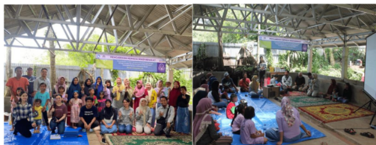
Gambar 3. Kegiatan sosialisasi pemanfaatan biogas