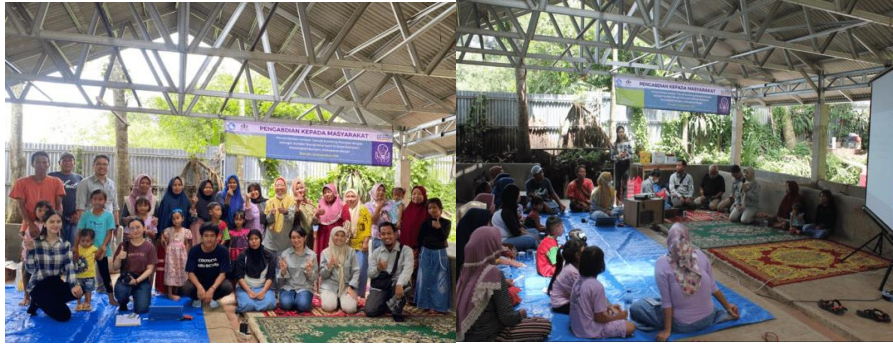
Gambar 3. Kegiatan sosialisasi pemanfaatan biogas