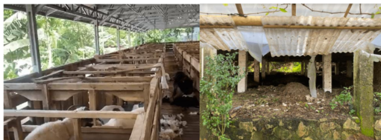
Gambar 1. Kandang kambing dan tempat kotoran kambing

Berdasarkan hasil survei diketahui bahwa El-Ardi Farm merupakan peternakan kambing yang menghasilkan kotoran kambing untuk dimanfaatkan sebagai pupuk ( Gambar 1 ). Pemanfaatan limbah tersebut berpotensi untuk dikembangkan menjadi material penghasil biogas yang dapat dimanfaatkan sebagai sumber energi ramah lingkungan. Selain itu diketahui bahwa warga Desa Sukasari masih menggunakan bahan bakar minyak tanah dan kayu bakar untuk memenuhi kebutuhan energi dalam kegiatan memasak. Kondisi tersebut terjadi karena belum terdapat alternatif sumber energi bersih yang ekonomis, sementara energi menjadi kebutuhan esensial dalam aktivitas rumah tangga. Warga belum mengetahui pemanfaatan kotoran kambing sebagai penghasil biogas yang dapat dimanfaatkan untuk menyalakan kompor.