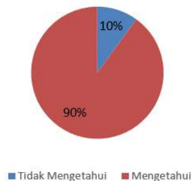
Gambar 4. Hasil Post Test Pengetahuan Pemanfaatan Air Hujan dan Wetland

Hasil diskusi dalam pelaksanaan PKM terkait pengelolaan air, pihak Pesantren Tahfiz Al-Qur'an Daarul Uluum Lindo, Bogor melakukan implementasi teknologi sederhana Pemanenan Air Hujan (PAH). Pihak pesantren memasang tandon berukuran 250 Liter di halaman belakang untuk menampung hujan yang disalurkan dari talang atap greenhouse Gambar 5. Pada tandon tersebut dipasang pipa untuk menyalurkan air pada tanaman-tanaman hidroponik.