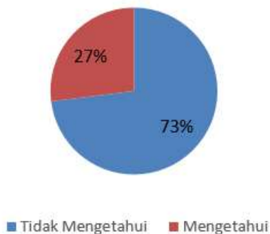
Gambar 5. Hasil Pre Test Pengetahuan Siswa Mengenai Kualitas Air

Berdasarkan grafik di bawah, terlihat pada Gambar 7 dan Gambar 8 , adanya peningkatan signifikan pengetahuan peserta mengenai kualitas air setelah dilakukan kegiatan demonstrasi uji kualitas air. Pada pre-test, sebelum kegiatan dimulai, sebanyak 73% peserta (siswa pesantren tingkat MTS dan MA) menyatakan tidak mengetahui tentang kualitas air, sedangkan hanya 27% yang mengetahui. Hal ini menunjukkan bahwa sebagian besar peserta belum memiliki pemahaman yang memadai terkait parameter kualitas air. Hasil post-test setelah kegiatan menunjukkan peningkatan drastis pengetahuan peserta, di mana 87% peserta menyatakan mengetahui kualitas air dan hanya 13% yang tidak mengetahui. Perubahan ini mencerminkan keberhasilan metode edukasi interaktif dan demonstrasi langsung dalam meningkatkan pemahaman siswa mengenai pentingnya memantau kualitas air untuk menjaga kesehatan dan lingkungan.