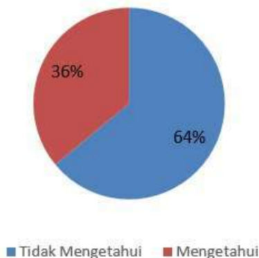
Gambar 3. Hasil Pre Test Pengetahuan Pemanfaatan Air Hujan dan Wetland

Dari hasil penyuluhan terkait PAH dan wetland dapat dilihat perbandingan hasil post dan pre test siswa seperti pada Gambar 3 pada hasil pre test yang dilakukan sebelum penyuluhan terdapat hanya 36% siswa mengetahui fungsi PAH dan wetland , dan Gambar 4 merupakan hasil post test terdapat 90% siswa mengetahui pentingnya PAH, siswa mendapat pengetahuan baru terkait teknologi sederhana dan menjadi memahami bahwa air hujan dan tanaman dapat bermanfaat sebagai teknologi sederhana.