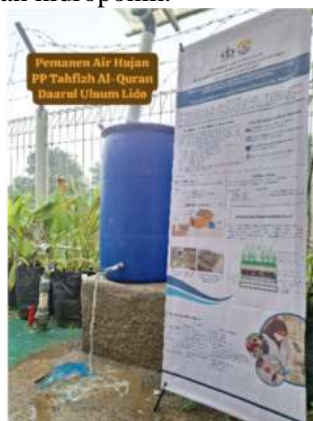
Gambar 5. Implementasi Pemanenan Air Hujan (PAH) di Pesantren Tahfiz Al-Qur'an Daarul Uluum Lindo

Hasil diskusi dalam pelaksanaan PKM terkait pengelolaan air, pihak Pesantren Tahfiz Al-Qur'an Daarul Uluum Lindo, Bogor melakukan implementasi teknologi sederhana Pemanenan Air Hujan (PAH). Pihak pesantren memasang tandon berukuran 250 Liter di halaman belakang untuk menampung hujan yang disalurkan dari talang atap greenhouse Gambar 5. Pada tandon tersebut dipasang pipa untuk menyalurkan air pada tanaman-tanaman hidroponik.