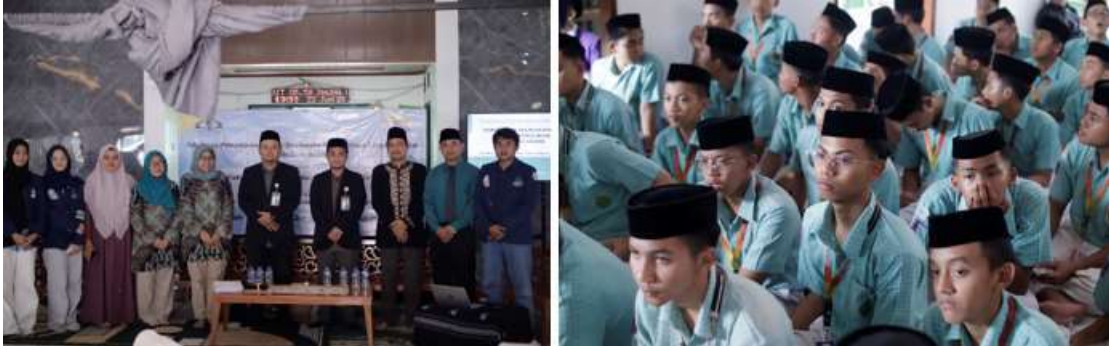
Gambar 1. Pelaksanaan PKM di Pesantren Tahfiz Al-Qur'an Daarul Uluum Lindo

Penyebaran kuesioner digunakan untuk mengetahui tingkat pengetahuan dan sikap siswa terhadap pengelolaan lingkungan khususnya air tanah. Adapun pelaksanaan penyuluhan yang dihadiri oleh perwakilan kepala pesantren, guru pendamping serta siswa. Total jumlah peserta pada saat penyuluhan sebanyak 270 orang. Kegiatan edukasi penyuluhan dan pelatihan dilaksanakan pada hari Minggu, 22 Juni 2025 pukul 13.00 – 15.30 WIB di masjid Aula Pesantren Tahfiz Al-Qur'an Daarul Uluum Lindo. Dapat dilihat pada Gambar 1 merupakan pelaksanaan PKM pada Pesantren Tahfiz Al-Qur'an Daarul Uluum Lindo, Bogor