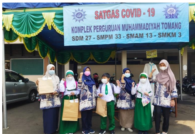
Gambar 1. Kegiatan Survei Pendahuluan di SD Muhammadiyah 27 Jakarta Barat

Kegiatan pengabdian kepada masyarakat ini didahului dengan survei pendahuluan kepada guru dan murid. Survei dilakukan pada bulan Agustus 2022 dengan membagikan kuesioner dalam bentuk google form untuk mengetahui tingkat pengetahuan guru dan murid terkait kesehatan gigi dan mulut. Berdasarkan hasil survei pendahuluan, didapatkan gambaran mengenai materi kesehatan gigi dan mulut yang dibutuhkan.