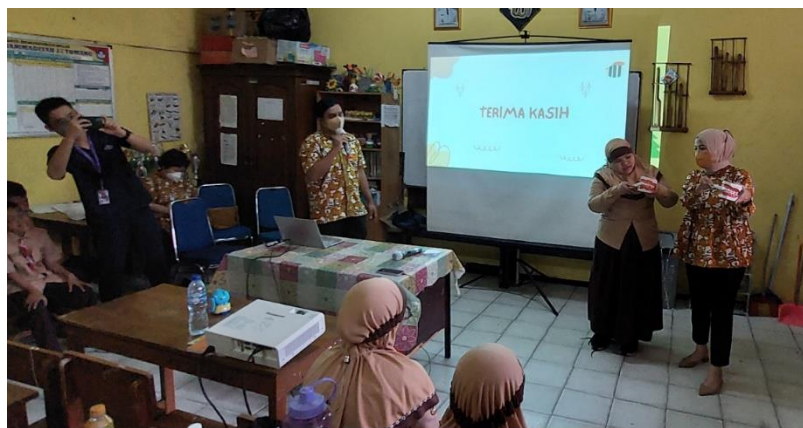
Gambar 4. Peragaan Cara Menyikat Gigi Menggunakan Model Pada Murid

Pelatihan cara menyikat gigi yang baik dan benar dilakukan dengan simulasi menggunakan model dan sikat gigi. Tim pelaksana secara bergantian memperagakan cara menyikat gigi mulai dari meletakkan bulu sikat pada tepi gusi membentuk sudut 45 derajat, menggetarkan sikat gigi sebanyak 10 sampai dengan 20 kali, dan gerakan membersihkan permukaan kunyah. Baik guru maupun murid kemudian diminta untuk memperagakan cara menyikat gigi secara mandiri seperti yang terlihat pada Gambar 4 dan 5. Seluruh peserta kegiatan terlihat antusias ketika memperagakan cara menyikat gigi sesuai instruksi. Setelah simulasi berakhir, kegiatan dilanjutkan dengan diskusi dan tanya jawab.