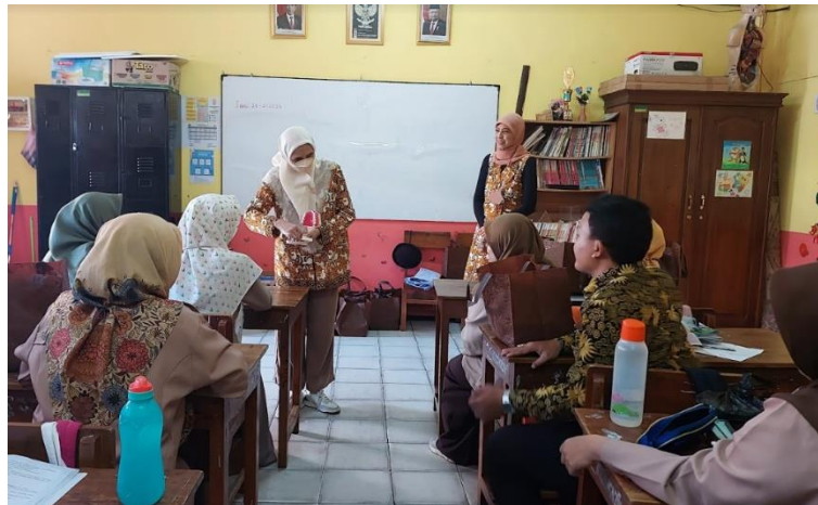
Gambar 3. Peragaan Cara Menyikat Gigi Menggunakan Model Pada Guru

Setelah itu para guru dan murid diberikan materi mengenai jenis-jenis masalah kesehatan gigi dan mulut, serta metode pencegahan masalah kesehatan gigi dan mulut. Materi diberikan kepada guru supaya mereka mampu memotivasi para murid untuk menjaga kesehatan gigi dan mulut. Tanpa pemahaman serta metode penyampaian materi yang tepat, para murid akan kurang memperhatikan apa yang disampaikan oleh guru sehingga peningkatan pengetahuan murid tidak tercapai (Arsyad dkk, 2018).