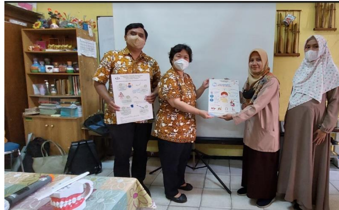
Gambar 5. Penyerahan Materi Poster Edukasi Pemeliharaan Kesehatan Gigi dan Mulut

Setelah pemberian materi edukasi, dilakukan evaluasi berupa pengisian post-test dalam bentuk google form untuk mengukur peningkatan pengetahuan. Tim pelaksana membagikan suvenir berupa sikat dan pasta gigi kepada seluruh guru dan murid yang berpartisipasi, untuk meningkatkan motivasi mereka dalam menjaga kesehatan gigi dan mulut. Sepuluh buah poster edukasi tentang cara memelihara kesehatan gigi dan mulut juga diserahkan secara kepada perwakilan guru. Poster edukasi akan dimanfaatkan oleh pihak sekolah sebagai media informasi bagi komunitas di lingkungan sekolah.