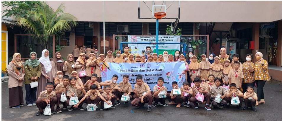
Gambar 6. Peserta dan Pelaksana Kegiatan Pengabdian Kepada Masyarakat

Pada akhir acara, perwakilan guru dan murid menyatakan bahwa kegiatan ini sangat bermanfaat positif bagi mereka dan perlu untuk dilaksanakan secara rutin. Berdasarkan wawancara yang dilakukan oleh tim pelaksana, perwakilan guru menyatakan bahwa mereka sangat terbantu dengan pemberian poster edukasi yang akan dimanfaatkan untuk berbagi informasi tentang kesehatan gigi dan mulut. Perwakilan guru juga menyatakan bahwa kegiatan edukasi terkait pemeliharaan kesehatan gigi dan mulut juga perlu dilaksanakan secara rutin dengan melibatkan peran orang tua sebagai bagian dari masyarakat secara keseluruhan.