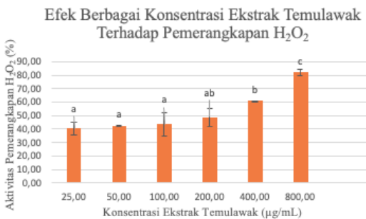
Gambar 3. Histogram Efek Berbagai Konsentrasi Ekstrak Temulawak terhadap Pemerangkapan H 2 O 2

Berdasarkan hasil uji normalitas dengan metode Shapiro-Wilk seperti yang ditunjukkan pada Tabel 2 dapat diketahui bahwa data setiap konsentrasi ekstrak C. xanthorrhiza Roxb., kontrol terdistribusi normal yaitu p > 0.05 maka uji statistik dapat dilanjutkan dengan uji ANOVA satu jalan.