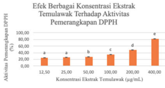
Gambar 1. Histogram Efek Berbagai Konsentrasi Ekstrak Temulawak terhadap Pemerangkapan DPPH

Data dari tabel 1 kemudian diolah dalam bentuk grafik. Grafik ini memuat aktivitas antioksidan pada masing-masing konsentrasi. Gambar dapat dilihat pada Gambar 1, 2, dan 3.