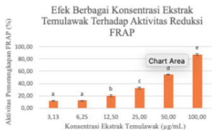
Gambar 2. Histogram Efek Berbagai Konsentrasi Ekstrak Temulawak terhadap Pemenangkapan FRAP