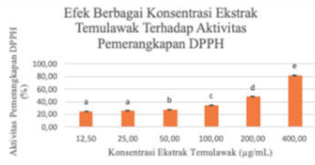
Gambar 1. Histogram Efek Berbagai Konsentrasi Ekstrak Temulawak terhadap Pemenangkapan DPPH

Data dari tabel 1 kemudian diolah dalam bentuk grafik. Grafik ini memuat aktivitas antioksidan pada masing-masing konsentrasi. Gambar dapat dilihat pada Gambar 1, 2, dan 3.