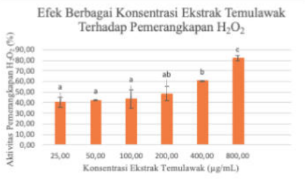
Gambar 3. Histogram Efek Berbagai Konsentrasi Ekstrak Temulawak terhadap Pemenangkapan H 2 O 2

Berdasarkan hasil uji normalitas dengan metode Shapiro-Wilk seperti yang ditunjukkan pada Tabel 2 dapat diketahui bahwa data set 3 konsentrasi ekstrak C. xanthorrhiza Roxb., kontrol terdistribusi normal yaitu p > 0.05 maka uji statistik dapat dilanjutkan dengan uji ANOVA satu jalan.