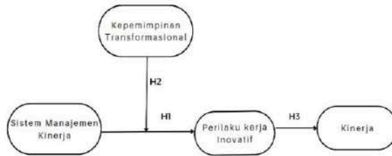
Gambar 1. Kerangka Pemikiran