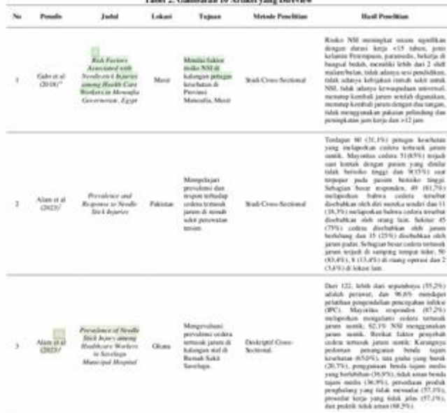
Tabel 2. Gambaran 10 Artikel yang Direview

penyediaan APD. Peningkatan jam kerja, shift malam, dan ketidaksihan terhadap tindakan pencegahan juga merupakan faktor risiko. Rumah sakit pemerintah selalu ramai, terutama di bangsal tertentu seperti ruang gawat darurat dan ruang bersalin yang rumah perawat kesehatan cenderung mengabaikan dan tidak mematuhi tindakan pencegahan NSI. 17