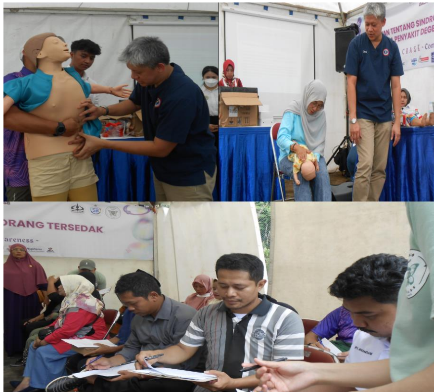
Gambar 3. Demonstrasi, Praktek Responden Dan Pengisian Kuesioner