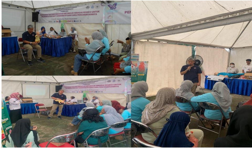
Gambar 2. Pelaksanaan, Presentasi dan Demonstrasi Penanganan Tersedak