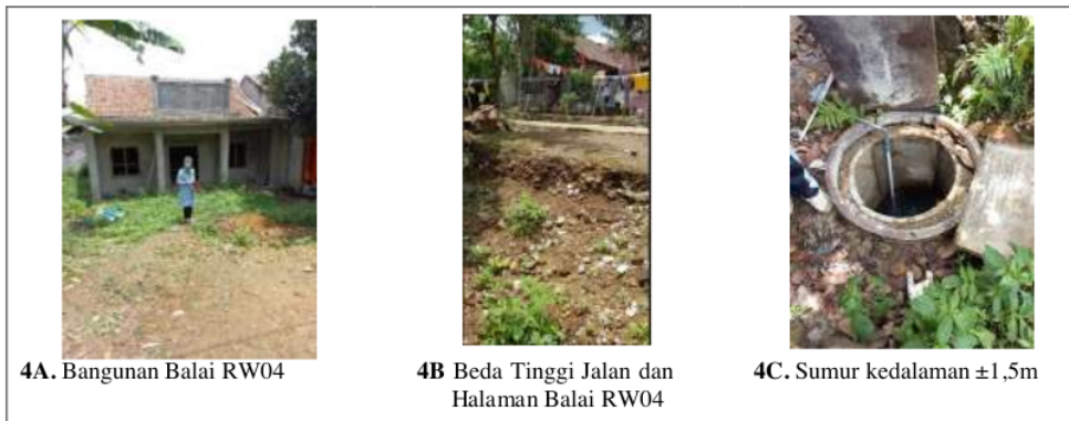
Gambar 4. Lokasi Percontohan Penerapan Desain Bangunan Resapan di Halaman Gedung Balai RW 04, Desa Cibodas

Berdasarkan koordinasi awal diperoleh informasi bahwa terdapat bangunan gedung Balai RW 04 yang baru selesai pembangunannya dan direncanakan akan dimanfaatkan yang untuk Pos Posyandu. Halaman yang tersedia di depan Gedung cukup luas dan direncanakan menjadi taman apotik hidup. Hasil survey lapangan menunjukkan bahwa posisi lokasi bangunan terletak di bawah elevasi jalan, sehingga menimbulkan resiko genangan bila terjadi hujan, dan terdapat sumur dengan kedalaman muka air \pm 1,5\text{m} . Sejalan dengan tema PkM yaitu ekodrainase atau drainase berwawasan lingkungan, maka tim PkM menawarkan lokasi tersebut sebagai lokasi percontohan penerapan sarana ekodrainase berupa desain bangunan resapan air. Kader Desa dan Kader RW04 menyambut baik program PkM yang ditawarkan.