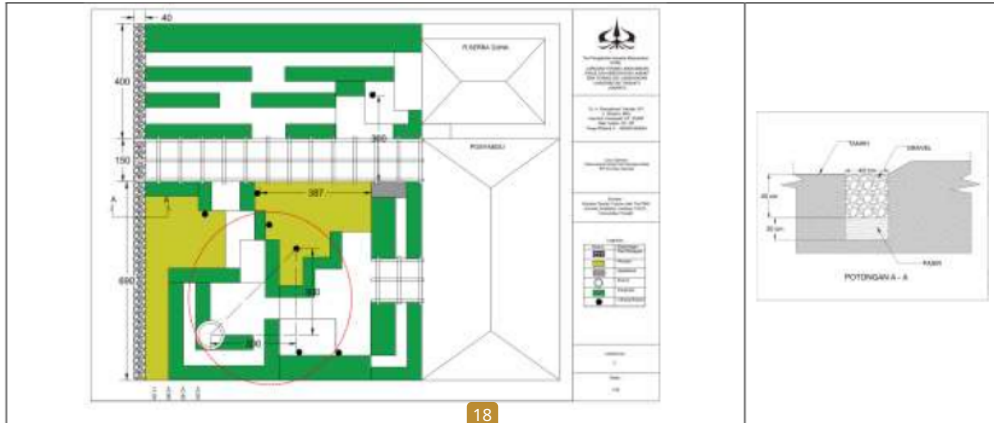
Gambar 5 Percontohan Desain Parit Resapan dan Lubang Resapan Biopori (LRB) di Halaman Gedung Balai RW 04, Desa Cibodas, Kecamatan Pasir Jambu

Percontohan desain konstruksi dan tata letak parit resapan dan Lubang Resapan Biopori (LRB) di Lokasi Percontohan Halaman Gedung Balai RW 04, Desa Cibodas, Kecamatan Pasir Jambu dapat dilihat pada gambar 5 di bawah ini dengan mengacu pada tabel 1.