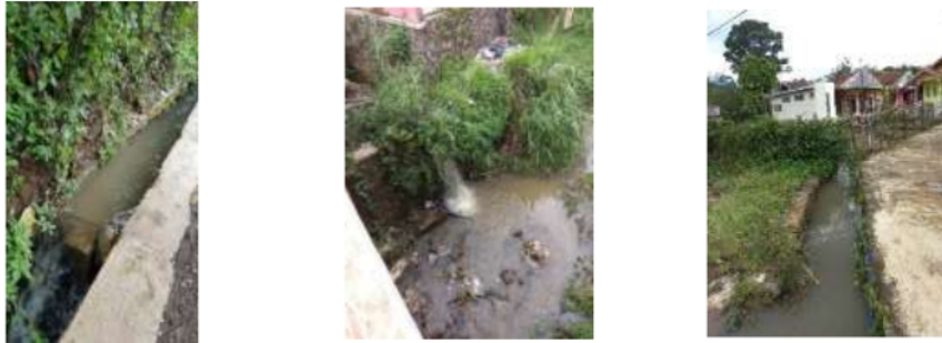
Gambar 3 Kondisi Drainase dan Sungai di Desa Cibodas, Kecamatan Pasir Jambu

Hal tersebut menunjukkan diperlukannya pemahaman konsep ekodrainase dalam mengurangi limpasan air hujan bagi masyarakat Desa Cibodas. Ekodrainase sebagai bagian dari upaya mewujudkan sistem pengelolaan kelebihan air dengan konsep konservasi di subDAS Ciwidey pada khususnya dan sebagai bagian dari pengelolaan sumber daya air secara terpadu di bagian Hulu DAS Citarum pada umumnya.