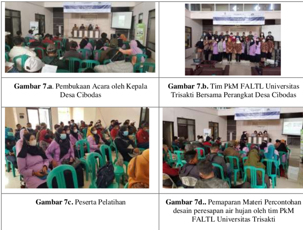
Gambar 7 Pelaksanaan Kegiatan Penyuluhan dan Pelatihan Ekodrainase

Kegiatan peningkatan kapasitas perangkat desa pada tanggal 7 Desember 2021 dengan acara penyuluhan wawasan konsep ekodrainase sebagai drainase berwawasan lingkungan serta pelatihan desain dan penempatan bangunan resapan hujan sebagai bagian dari ekodrainase. Optimalisasi peran serta masyarakat merupakan salah satu kunci efektifitas penerapan ekodrainase. Oleh karena itu, pemberdayaan masyarakat seharusnya diawali dengan peningkatan kapasitas perangkat desa melalui kegiatan penyuluhan dan pelatihan, sehingga pemahaman dan kompetensi yang dimiliki oleh pemerintah desa serta para kader tingkat Desa dan RW dapat memberikan memberikan contoh sekaligus menjadi penggerak masyarakat dalam penerapan drainase yang berwawasan lingkungan atau ekodrainase. Antusiasme peserta yang hadir dapat dilihat pada Gambar 7, yang merupakan dokumentasi saat berlangsungnya acara penyuluhan dan pelatihan.