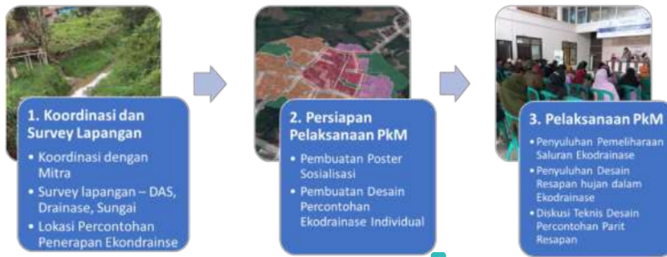
Gambar 2 Tahapan Kegiatan Pengabdian kepada Masyarakat di Desa Cibodas, Kecamatan Pasir Jambu, Kabupaten Bandung