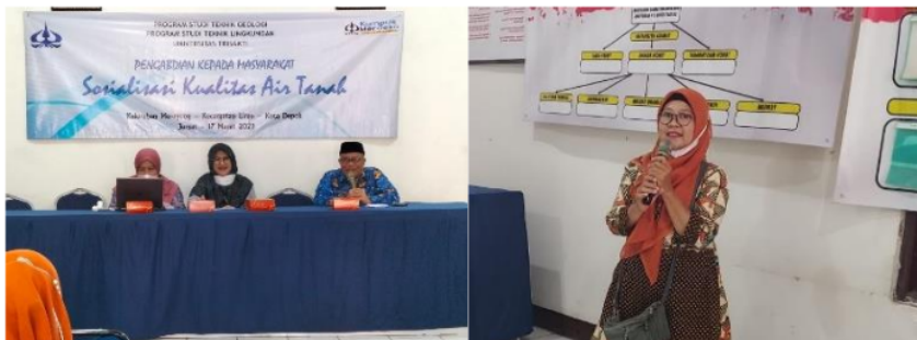
Gambar 2. Kegiatan penyuluhan kualitas air tanah