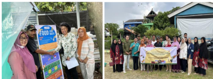
Gambar 4 Penyerahan Insektarium lalat hitam (BSF) untuk budidaya maggot untuk pengurangan FLW kepada Ketua RW 20, Desa Ciangsana, Kecamatan Gunung Putri, Kabupaten Bogor

Dalam penyuluhan dan pelatihan ini, masyarakat RW 20 perlu memperhatikan dan mengikuti prosedur secara benar dalam menggunakan maggot sebagai pengolahan limbah organik. Perlu pengawasan agar tidak menyebabkan masalah lingkungan lainnya seperti bau yang tidak sedap atau masalah kesehatan.