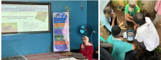
Gambar 3 Pelatihan Pengolahan Sampah Organik menggunakan maggot (BSF)

Pelatihan yang diberikan berupa penjelasan pemrosesan sampah makanan menggunakan larva lalat tentara hitam atau Black Soldier fly (BSF), sekaligus praktik dalam membudidayakan larva BSF (Gambar 3). Masyarakat terlihat sangat antusias karena Tim PkM FALTL Universitas Trisakti telah menyiapkan insektarium sederhana agar budidaya maggot sebagai media pemrosesan sampah organik dapat langsung diterapkan. Pelatihan dilaksanakan dengan memberikan materi tentang setiap tahapan budidaya maggot yaitu dimulai dari persiapan, pembibitan, hingga panen (Gambar 4).