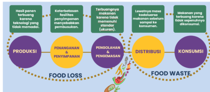
Gambar 2 Timbulan sampah organik berasal dari FLW pada rantai pasok makanan

Penyuluhan tentang FLW kepada ibu-ibu pengurus Bank Sampah Cantik serta aparat RW 20 didahului dengan penjelasan tentang pengertian dasar serta sumber timbulan sampah organik berasal dari food loss dan food waste (FLW) pada rantai pasok makanan (Gambar 2). Masyarakat peserta penyuluhan dan pelatihan sangat antusias berdiskusi mengenai perhatian global terhadap akibat FLW dan keberlangsungan bumi karena Indonesia dinyatakan peringkat tiga sebagai negara dengan angka FLW tertinggi di dunia ((The Economist Intelligence & Unit and Barilla Foundation, 2021) dan (Media Indonesia, 2022).