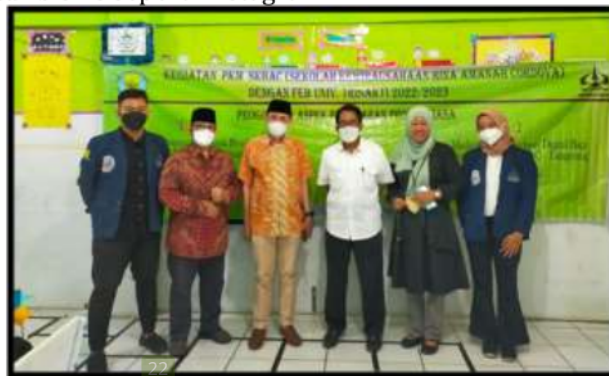
Gambar 1. Tim PKM Fakultas Ekonomi dan Bisnis Universitas Trisakti

Pemaparan materi tersebut diikuti dengan penayangan contoh penggunaan media sosial oleh UMKM dalam memasarkan produk. Melalui gadget yang dibawa saat penyuluhan, para peserta juga dapat mengakses berbagai jenis produk UMKM yang ditawarkan di media sosial. Kemudian, diadakan tanya jawab yang diikuti peserta dengan antusias. Peserta yang telah memiliki usaha dan menggunakan media sosial untuk memasarkan produknya ingin memahami lebih lanjut bagaimana menggunakan fitur-fitur dalam media sosial terutama yang mempunyai fitur bisnis seperti Instagram.