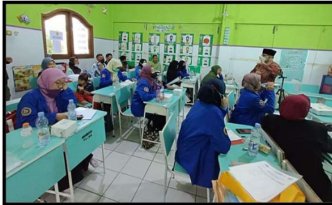
Gambar 2. Suasana diskusi peserta dengan pemateri.