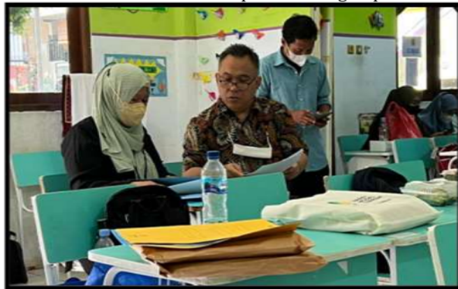
Gambar 3. Tim PKM sedang mempersiapkan materi