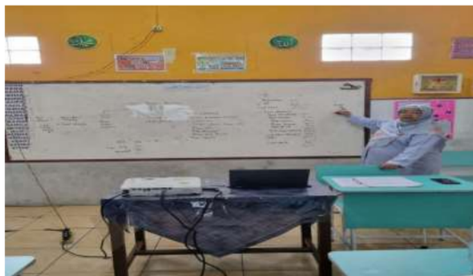
Gambar 2. Pemateri menyampaikan materi Pelatihan

Dari jawaban peserta terhadap kuesioner pasca pelatihan, terlihat bahwa mereka mengharapkan adanya pelatihan lanjutan yang dapat menambah pemahaman mereka tentang HPP dan lainnya. Hal ini menjadi masukan bagi Tim PKM FEB Universitas Trisakti agar memberikan materi pelatihan berikutnya, seperti perhitungan Harga Pokok Penjualan, Neraca maupun Laporan Laba/Rugi. Tentu kerja sama yang terjalin selama ini antara Sekolah Kewirausahaan Bina Amanah Cordova dan FEB Universitas Trisakti akan memudahkan koordinasi dan pelaksanaan PKM berikutnya.