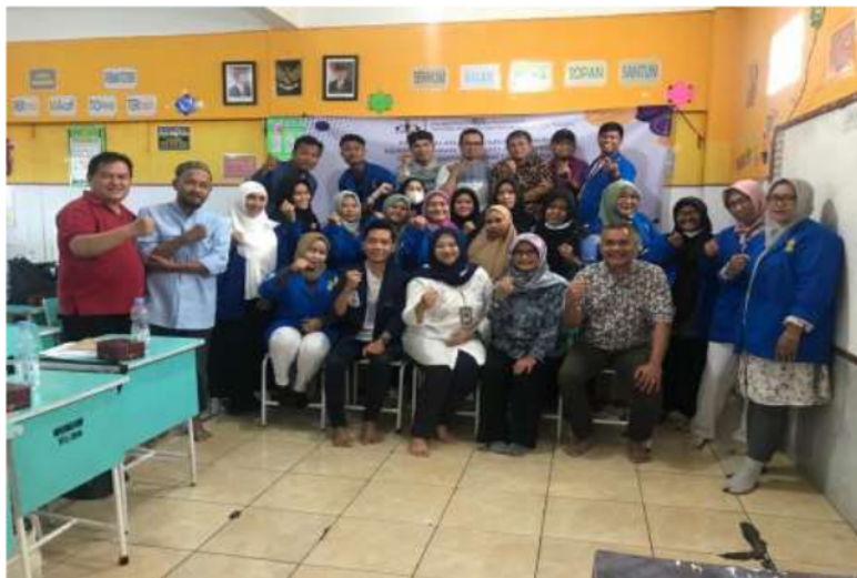
Gambar 4. Foto Bersama Pemateri dan Peserta

Gambar 4 adalah foto bersama semua pemateri dari Fakultas Ekonomi dan Bisnis Usakti dan peserta yang merupakan siswa Sekolah Kewirausahaan Bina Amanah Cordova.