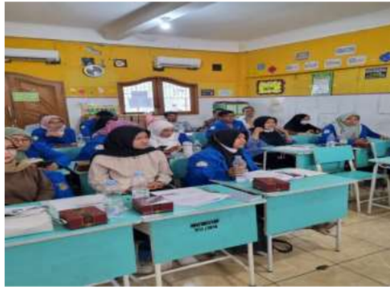
Gambar 3. Suasana di Kelas.

Pada Gambar 2, terlihat bahwa pemateri dari Fakultas Ekonomi dan Bisnis Universitas Trisakti sedang memberi penjelasan tentang Harga Pokok Produksi. Materi disampaikan secara lisan dan peserta menerima hand out yang juga berisi materi Latihan. Suasana di kelas saat peserta menyimak materi nampak pada gambar 3.