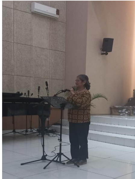
Gambar 2. Penyampaian Materi Tentang Peningkatan Kesadaran Masyarakat Tentang Infeksi Tuberkulosis Paru Pasca Covid-19