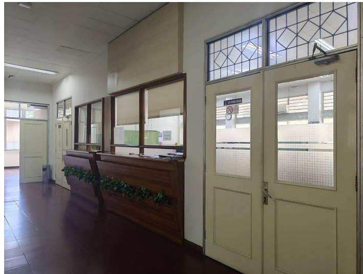
Gambar 1. Ruang Operasional Perkuliahan Gedung AO Lt. 201

Menurut laporan dari sebuah artikel di The Jakarta Post , integrasi elemen alam dalam lingkungan pendidikan dapat meningkatkan kesejahteraan siswa dan menciptakan suasana belajar yang lebih baik (The Jakarta Post, 2023). Artikel tersebut menekankan bahwa penggunaan tanaman indoor , pencahayaan alami, dan bahan-bahan ramah lingkungan tidak hanya meningkatkan estetika ruang tetapi juga mendukung kesehatan mental penggunanya.