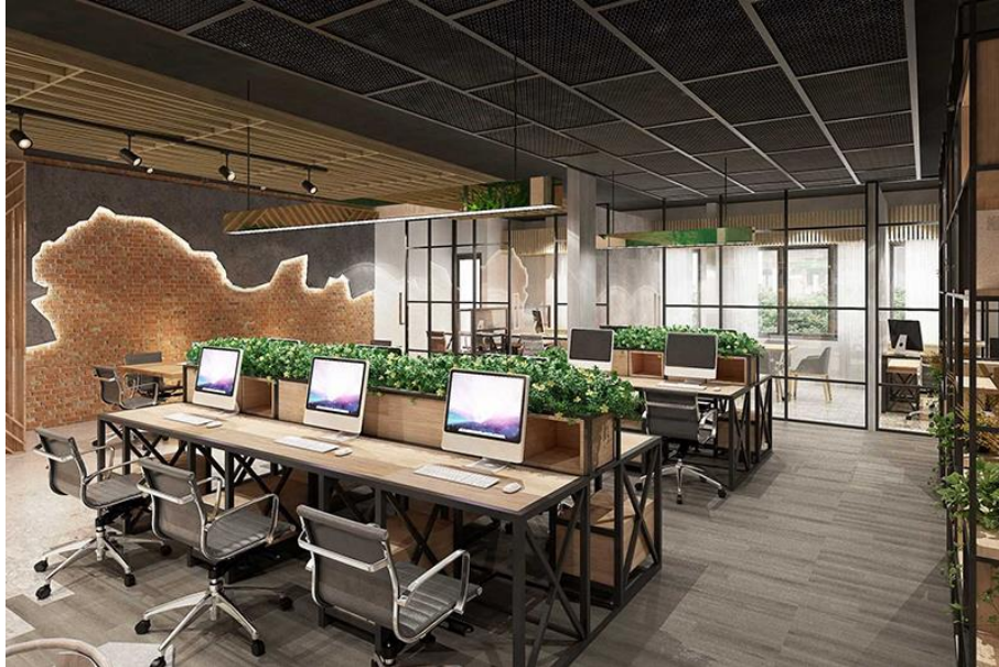
Gambar 3. Contoh Image Desain Interior Biophilic

Hasil analisis dikaitkan dengan kerangka teoritis yang telah dibangun. Peneliti mendiskusikan bagaimana penerapan desain biophilic dapat mempengaruhi kesejahteraan dan produktivitas pengguna, serta bagaimana pengalaman pengguna dapat menjadi dasar untuk pengembangan desain di masa depan. Proses ini juga melibatkan refleksi kritis terhadap data yang telah dikumpulkan dan analisis untuk mendapatkan wawasan baru.