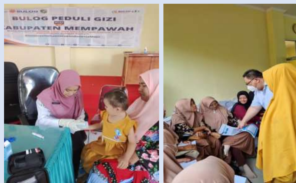
Gambar 5. Skrining Anemia dan Pemeriksaan Kesehatan