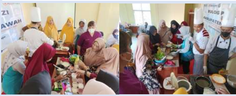
Gambar 4. Demonstrasi pembuatan dan penyajian makanan untuk balita