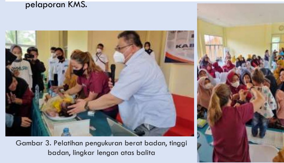
Gambar 3. Pelatihan pengukuran berat badan, tinggi badan, lingkaran lengan atas balita