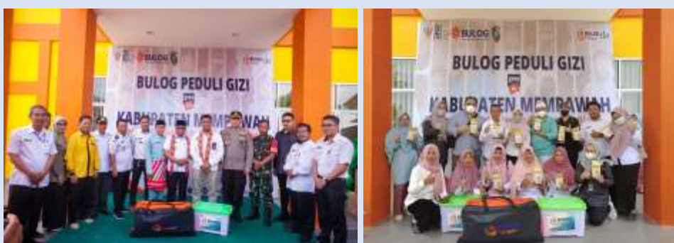
Gambar 6. Pembagian Beras Fortifikasi secara simbolik kepada Wakil Bupati Mempawah oleh Pemimpin Wilayah Perum Bulog Kalimantan Barat