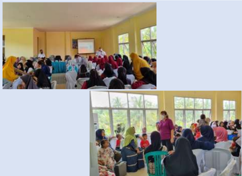
Gambar 2. Penyuluhan tentang Gizi Keluarga dan PHBS Rumah Tangga