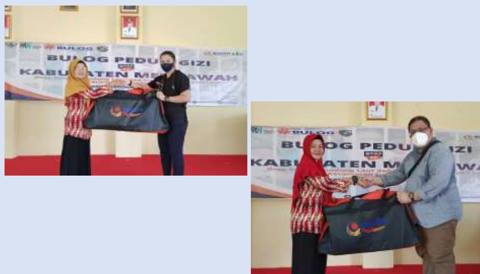
Gambar 1. Pembagian Antropometri Kit kepada Kader Posyandu