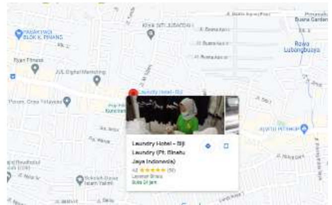
Gambar 2. Peta Lokasi Tempat Pelatihan

Pelatihan dilakukan secara luring di lokasi kerja PT BIJI, yaitu di Jl. Sultan Ageng Tirtayasa No.20, Kunciran, Kec. Pinang, Kota Tangerang, Banten 11440. Berikut ini pada Gambar 2 ditunjukkan peta lokasi kegiatan pengabdian ini.