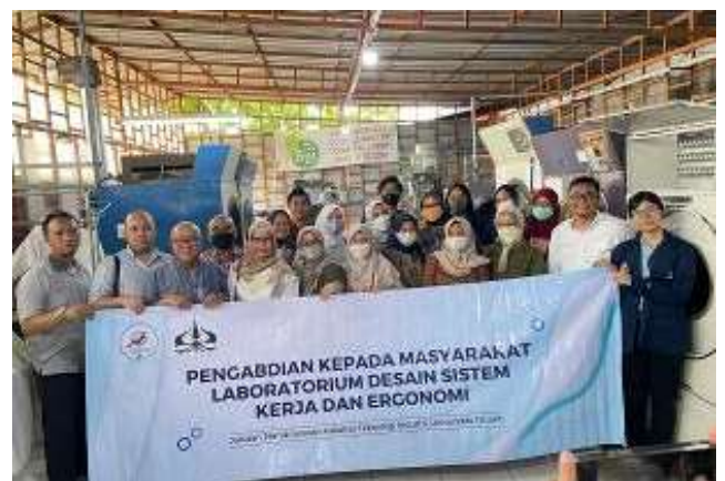
Gambar 5. Foto Bersama Tim Pelatih dengan Peserta Pelatihan