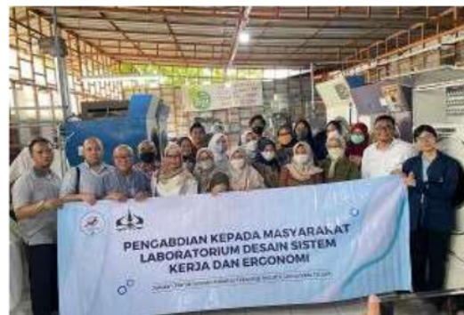
Gambar 5. Foto Bersama Tim Pelatih dengan Peserta Pelatihan