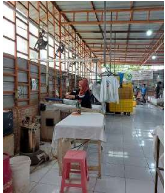
Gambar 7. Suasana Tempat Kerja Laundry

Untuk menilai keberhasilan program pelatihan, sebuah survei dilakukan dengan memberikan kuesioner. Umpan balik yang diperoleh dari survei ini adalah peserta menyatakan setuju bahwa mereka mendapatkan benefit dari materi pelatihan. Dengan diberikan pelatihan, peserta merasakan dukungan dari perusahaan dalam peningkatan pengetahuan untuk pelaksanaan tugas keseharian mereka. Menurut peserta, pemateri dapat menyampaikan materinya dengan sangat baik dan memberikan kejelasan seperti yang dibutuhkan oleh peserta. Ketepatan waktu pelatihan dinilai sangat baik sehingga tidak mengganggu target penyelesaian pekerjaan harian.