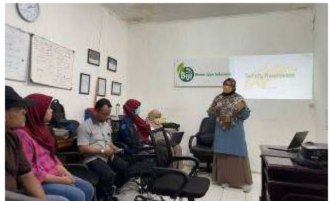
Gambar 4. Pemaparan Materi Safety Awareness

Pembukaan kegiatan dilakukan dengan sambutan dari PT BIJI yang diwakili oleh Manajer Produksi, serta dari pihak Univeristas Trisakti diwakili oleh Sekretaris Program Studi dan Kepala Laboratorium Desain Sistem Kerja dan Ergonomi. Setelah itu dilanjutkan dengan pemaparan materi oleh tim pelatih, salah satunya adalah yang seperti terlihat pada Gambar 4 dan diakhiri dengan sesi tanya jawab dan foto bersama seperti pada Gambar 5 dan Gambar 6.