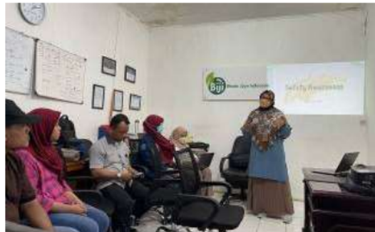
Gambar 4. Pemaparan Materi Safety Awareness

Pembukaan kegiatan dilakukan dengan sambutan dari PT BIJI yang diwakili oleh Manajer Produksi, serta dari pihak Univeristas Trisakti diwakili oleh Sekretaris Program Studi dan Kepala Laboratorium Desain Sistem Kerja dan Ergonomi. Setelah itu dilanjutkan dengan pemaparan materi oleh tim pelatih, salah satunya adalah yang seperti terlihat pada Gambar 4 dan diakhiri dengan sesi tanya jawab dan foto bersama seperti pada Gambar 5 dan Gambar 6.