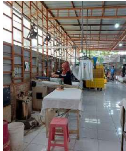
Gambar 7. Suasana Tempat Kerja Laundry

Untuk menilai keberhasilan program pelatihan, sebuah survei dilakukan dengan memberikan kuesioner. Umpan balik yang diperoleh dari survei ini adalah peserta menyatakan setuju bahwa mereka mendapatkan benefit dari materi pelatihan. Dengan diberikan pelatihan, peserta merasakan dukungan dari perusahaan dalam peningkatan pengetahuan untuk pelaksanaan tugas keseharian mereka. Menurut peserta, pemateri dapat menyampaikan materinya dengan sangat baik dan memberikan kejelasan seperti yang dibutuhkan oleh peserta. Ketepatan waktu pelatihan dinilai sangat baik sehingga tidak mengganggu target penyelesaian pekerjaan harian.