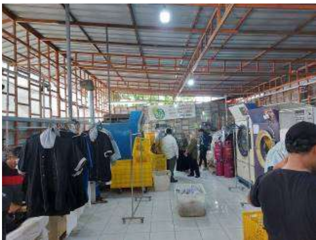
Gambar 1. Suasana Tempat Kerja Laundry

dengan salah satu mitranya yaitu PT Binatu Jaya Indonesia (PT. BIJI) yang melayani jasa binatu untuk rumah tangga, hotel, dan restoran. Mitra adalah perusahaan yang sangat mempertimbangkan kesehatan dan keselamatan kerja. Pelatihan mengenai kesadaran keselamatan dan kesehatan kerja ini memerlukan dukungan dari pihak akademisi yang memiliki rekam jejak pada kajian kesehatan dan keselamatan kerja. Safety menjadi salah satu body of knowledge keilmuan teknik industri. Pada Program Studi Teknik Industri, Laboratorium Desain Sistem Kerja dan Ergonomi memiliki kelompok keahlian dan peneliti yang mendalami permasalahan safety . Berikut ini pada Gambar 1 ditunjukkan suasana tempat kerja laundry yang dimiliki oleh PT BIJI. Di tempat inilah dilakukan analisis situasi untuk menentukan kebutuhan pelatihan.