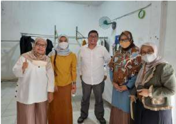
Gambar 6. Diskusi Informal dengan Pemilik sekaligus Direktur Utama PT Binatu Jaya Indonesia

Kegiatan pelatihan ini dinilai bermanfaat untuk berbagai pihak, yaitu peserta yang terdiri dari pengelola dan pekerja, komunitas penyedia jasa laundry , yang dalam hal ini adalah asosiasi pengusaha laundry dan tentunya bagi mahasiswa dan dosen yang terlibat dan berkontribusi dalam pelatihan ini. Mahasiswa belajar bahwa pada sektor jasa pun terdapat risiko bahaya yang memiliki pengaruh pada kesehatan dan keselamatan kerja. Berikut ini pada Tabel 1 dipaparkan hasil yang dicapai setelah kegiatan pelatihan ini dilakukan.