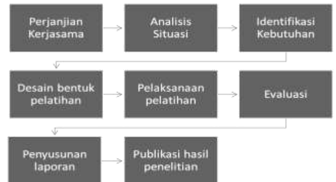
Gambar 3. Alur Pelaksanaan Kegiatan Pengabdian Kepada Masyarakat

Berikut ini pada Gambar 3 disajikan alur pelaksanaan kegiatan pengabdian kepada masyarakat. Pada tahap awal dilakukan perjanjian kerja sama antara Fakultas Teknologi Industri Universitas Trisakti dengan PT Binatu Jaya Indonesia sebagai mitra untuk pelaksanaan kegiatan tri dharma perguruan tinggi. Setelah itu dilakukan analisis situasi pada tempat kerja laundry seperti yang dapat dilihat pada Gambar 1.