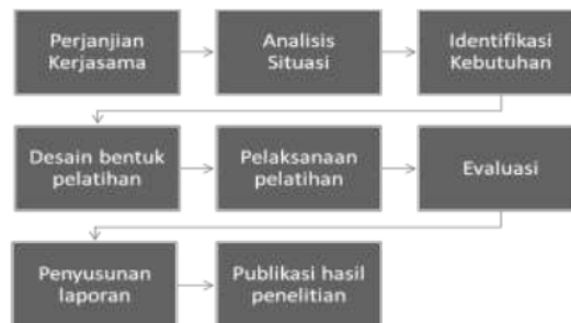
Gambar 3. Alur Pelaksanaan Kegiatan Pengabdian Kepada Masyarakat

Berikut ini pada Gambar 3 disajikan alur pelaksanaan kegiatan pengabdian kepada masyarakat. Pada tahap awal dilakukan perjanjian kerja sama antara Fakultas Teknologi Industri Universitas Trisakti dengan PT Binatu Jaya Indonesia sebagai mitra untuk pelaksanaan kegiatan tri dharma perguruan tinggi. Setelah itu dilakukan analisis situasi pada tempat kerja laundry seperti yang dapat dilihat pada Gambar 1.