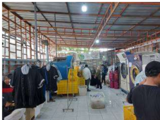
Gambar 1. Suasana Tempat Kerja Laundry

dengan salah satu mitranya yaitu PT Binatu Jaya Indonesia (PT. BIJI) yang melayani jasa binatu untuk rumah tangga, hotel, dan restoran. Mitra adalah perusahaan yang sangat mempertimbangkan kesehatan dan keselamatan kerja. Pelatihan mengenai kesadaran keselamatan dan kesehatan kerja ini memerlukan dukungan dari pihak akademisi yang memiliki rekam jejak pada kajian kesehatan dan keselamatan kerja. Safety menjadi salah satu body of knowledge keilmuan teknik industri. Pada Program Studi Teknik Industri, Laboratorium Desain Sistem Kerja dan Ergonomi memiliki kelompok keahlian dan peneliti yang mendalami permasalahan safety . Berikut ini pada Gambar 1 ditunjukkan suasana tempat kerja laundry yang dimiliki oleh PT BIJI. Di tempat inilah dilakukan analisis situasi untuk menentukan kebutuhan pelatihan.