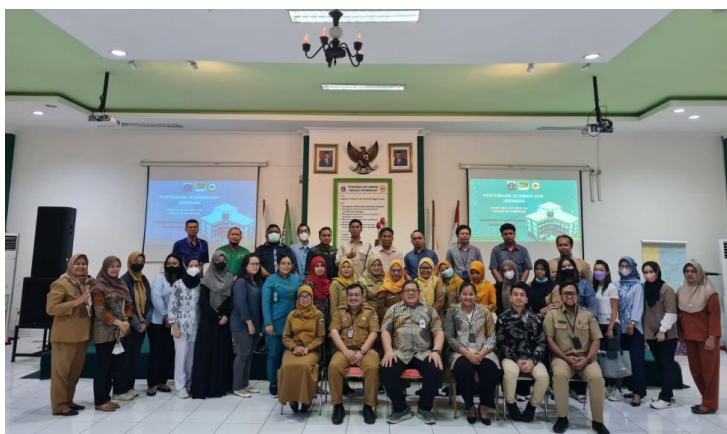
Gambar 1. Foto Pelatihan di Auditorium Puskesmas Kecamatan Grogol Petamburan