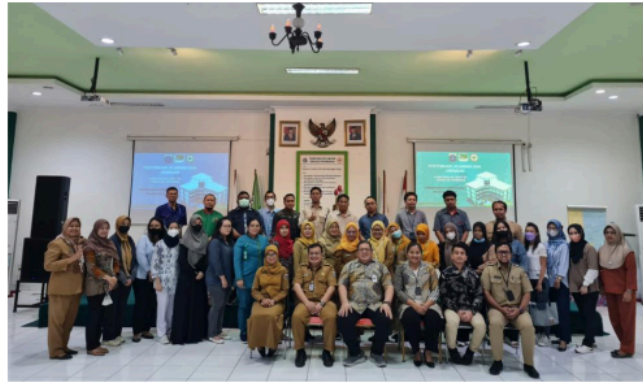
Gambar 1. Foto Pelatihan di Auditorium Puskesmas Kecamatan Grogol Petamburan