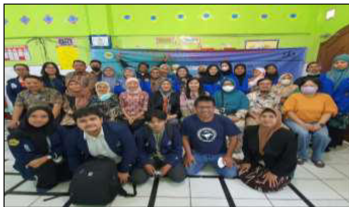
Gambar 3. Pelaksanaan PKM di Sekolah Kewirausahaan Bina Amanah Cordova

Pelaksanaan Pengabdian Kepada Masyarakat ini, diikuti oleh 20 orang peserta dengan kondisi demografi jumlah peserta yang berjenis kelamin pria sebanyak 3 atau 15 persen dan wanita sebanyak 17 atau 85 persen. Jumlah peserta yang berusia antara 16-20 tahun, sebanyak 4 orang atau 20 persen, 21-30 tahun sebanyak 3 orang atau 15 persen, 31-40 tahun sebanyak atau 20 persen, dan 41-66 tahun sebanyak 9 orang atau 45 persen. Jumlah peserta dengan status menikah, terdapat sebanyak 11 orang atau 55 persen, belum menikah sebanyak 7 orang atau 35 persen dan cerai sebanyak 2 orang atau 10 persen. Namun, kumlah peserta dengan pendidikan Sekolah Menengah Atas sebanyak 15 orang atau 75 persen, sedangkan Diploma Satu sebanyak 4 orang atau 20 persen, dan Strata Satu sebanyak 1 orang atau 5 persen.