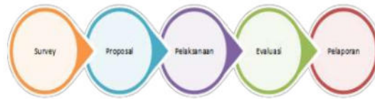
Gambar 2. Prosedur Pelaksanaan Pengabdian Kepada Masyarakat

pembiayaan Ultra Mikro kepada peserta. Peserta juga diberikan kesempatan untuk mengisi evaluasi pelaksanaan yang meliputi aspek keberlanjutan, aspek kognitif, aspek transparansi, dan aspek afektif, serta memberikan masukan serta hal yang paling mengesankan atas pelaksanaan pengabdian kepada masyarakat. Adapun Prosedur pelaksanaan aktivitas Pengabdian Kepada Masyarakat dapat dilihat pada gambar 2.