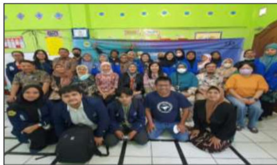
Gambar 3. Pelaksanaan PKM di Sekolah Kewirausahaan Bina Amanah Cordova

Pelaksanaan Pengabdian Kepada Masyarakat ini, diikuti oleh 20 orang peserta dengan kondisi demografi jumlah peserta yang berjenis kelamin pria sebanyak 3 atau 15 persen dan wanita sebanyak 17 atau 85 persen. Jumlah peserta yang berusia antara 16-20 tahun, sebanyak 4 orang atau 20 persen, 21-30 tahun sebanyak 3 orang atau 15 persen, 31-40 tahun sebanyak atau 20 persen, dan 41-66 tahun sebanyak 9 orang atau 45 persen. Jumlah peserta dengan status menikah, terdapat sebanyak 11 orang atau 55 persen, belum menikah sebanyak 7 orang atau 35 persen dan cerai sebanyak 2 orang atau 10 persen. Namun, kumlah peserta dengan pendidikan Sekolah Menengah Atas sebanyak 15 orang atau 75 persen, sedangkan Diploma Satu sebanyak 4 orang atau 20 persen, dan Strata Satu sebanyak 1 orang atau 5 persen.