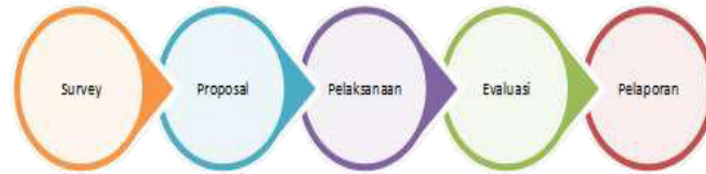
Gambar 2. Prosedur Pelaksanaan Pengabdian Kepada Masyarakat

pembiayaan Ultra Mikro kepada peserta. Peserta juga diberikan kesempatan untuk mengisi evaluasi pelaksanaan yang meliputi aspek keberlanjutan, aspek kognitif, aspek transparansi, dan aspek afektif, serta memberikan masukan serta hal yang paling mengesankan atas pelaksanaan pengabdian kepada masyarakat. Adapun Prosedur pelaksanaan aktivitas Pengabdian Kepada Masyarakat dapat dilihat pada gambar 2.